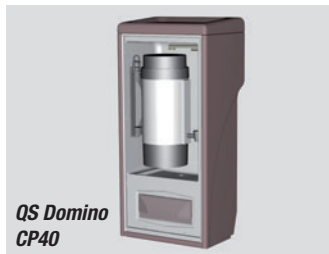
QS Domino CP40

E in Unternehmen aus Neu-Ulm, Deutschland, hat es sich zur Aufgabe gemacht, Busreisen technisch so komfortabel und kompromisslos wie möglich zu gestalten. TM Technischer Gerätebau, erfolgreicher Hersteller von Komponenten für Straßen- und Schienenfahrzeuge, bietet nun neue Service-Lösungen für Busse an. Staubsaugeranlagen für Reise-, Mini- und Midibusse in zwölf