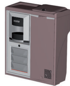
QS Concept Lavazza

fePerfect 40 ebenfalls intelligent gelöst. Denn das innovative Brühverfahren ermöglicht es, während der Fahrt frischen Kaffee zuzubereiten, um bei der eingeplanten Pause keine wertvolle Zeit zu verlieren und trotzdem die Omnibuskunden mit frisch gebrühtem Kaffee zu versorgen. Eine weitere Küchenlösung stellen die Küchen QS Duo und QS Concept da, die mit der Kombination aus Kühlschrank und Espresso Maschine oder CafePerfect Modellen den optimalen Service je nach Wunsch des Busunternehmers bieten. Durch die kompakten Maße sind sie für den ersten Einstieg geeignet und direkt hinter dem Reisebegleitsitz zu installieren. Service hat also beim Komponentenhersteller TM einen großen Stellenwert. Um auch beim Kundenservice